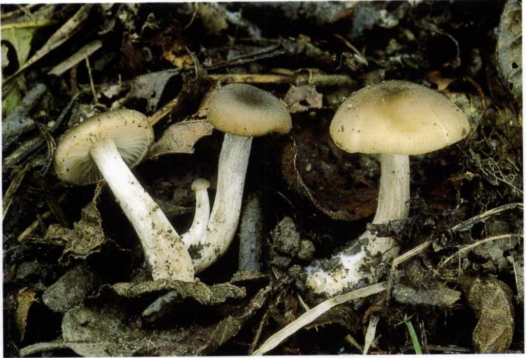
Entoloma sericatum (Britzelm.) Sacc.