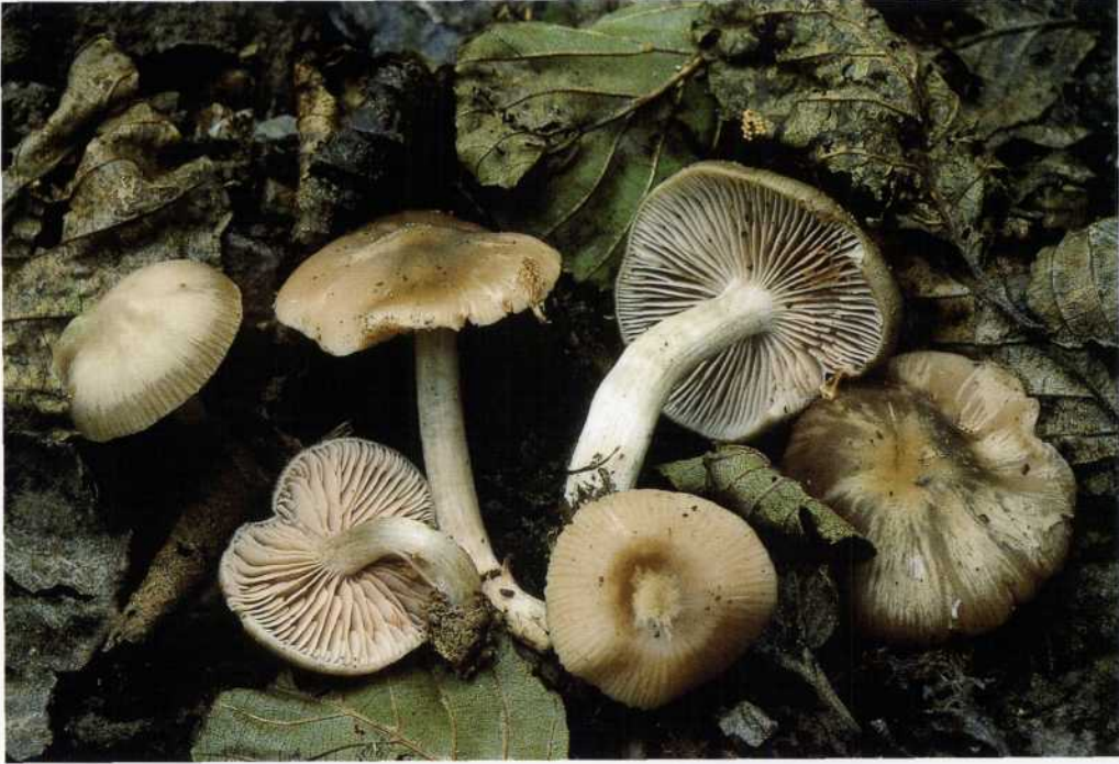
Entoloma inusitatum Noordel., Enderle et Lammers