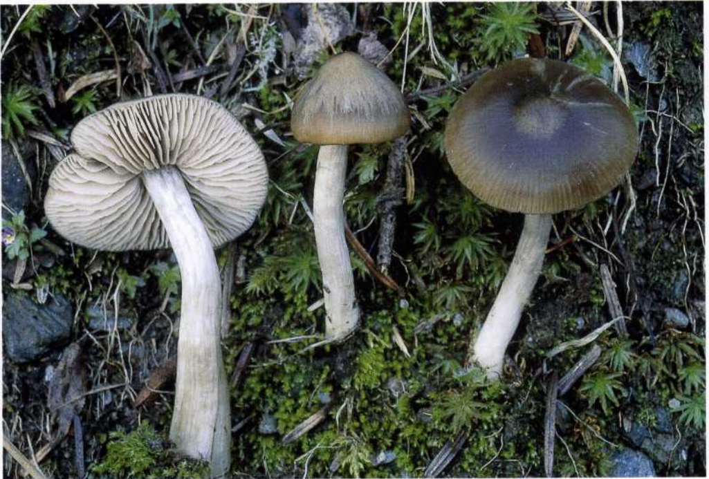
Entoloma turbidum (Fr.: Fr.) Quéf.