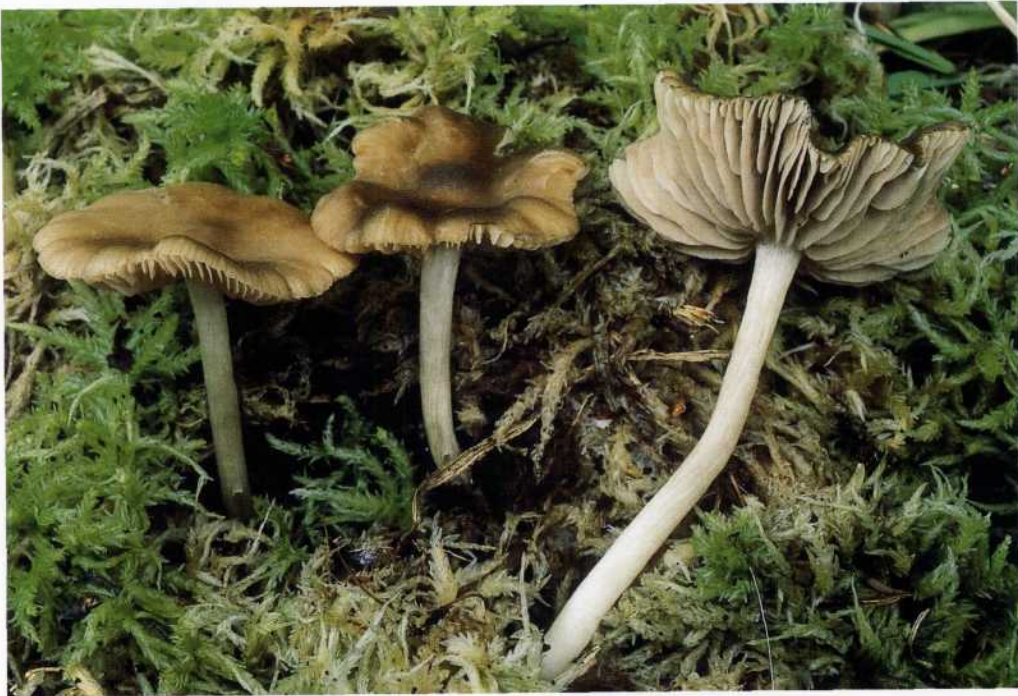
Entoloma politum (Pers.: Fr.) Donk